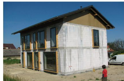
Obr. 4 – Další z domů, kde je možné dosáhnout na kvalitu certifikovaného pasivního domu. Obec Nevíd, foto Ing. Martin Konečný, projektový návrh. Ing. Štěpánka Hamatová