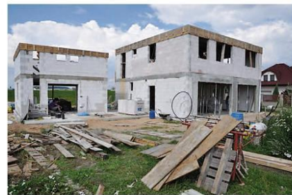
Obr. 3 – Pokud bude vše dokončeno dle projektu, tak dům získá certifikát Qualitätsgeprüftes Passivhaus, projekt již byl certifikován u firmy EZA! v SRN. Obec Lysá nad Labem, foto Ing. Jiří Vápeník, projektový návrh: Arch. Dirk Friedrich Sehmsdorf