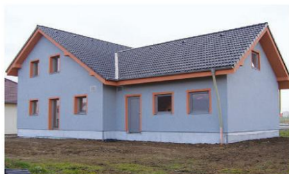
Obr. 6 – Nízkonákladový dům v ceně 2,5 mil Kč splňuje veškerá očekávání majitelů. Hodnota dle PHPP je 23,8 kWh/m 2 a, dle TNI je to 18 kWh/m 2 /rok. Obec Horažďovice, foto Jaroslav Pelech, projektový návrh. Ing. Jana Janochová