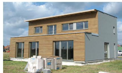
Obr. 7 – Obec Srch, foto Ing. Martin Konečný, projektový návrh. Atelier L

Pouze tímto vidíme možnost jak zajistit klientovi požadovanou kvalitu bez kompromisů. Vzhledem k situaci jaká v tomto ohledu v ČR je jen velmi těžko pak laická veřejnost může považovat za pasivní domy jiné než certifikované.