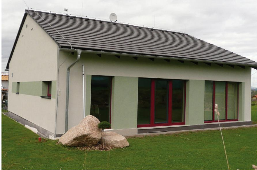
Obr. 2 – První „Qualitätsgeprüftes Passivhaus“ v ČR, certifikováno PHI Darmstadt. Obec Jenišov u Karlových Varů, projektový návrh. Ing. Štěpánka Hamatová