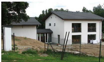
Obr. 5 – Velmi kvalitní dům, těsně nad certifikovatelnou hranicí, dle definitivního přepočtu PHPP po dokončení stavby 17 kWh/m 2 a. Dle měření v sezoně 2010/2011: 15 kWh/m 2 a. Obec Hromnice, foto Ing. Martin Konečný, projektový návrh. Ing. Štěpánka Hamatová