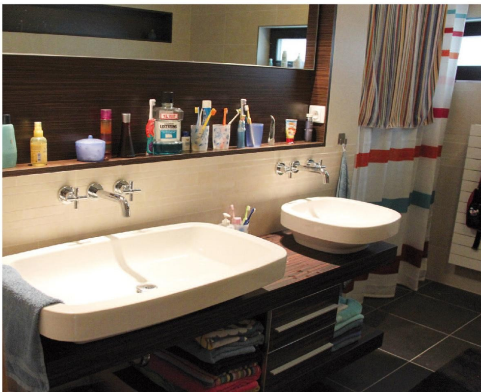
Dvě umyvadla ze zdravotní keramiky na desce

Pohoda v koupelně nezáleží jen na její velikosti, ale především na funkci prostoru. Při návrhu nových i rekonstruovaných koupelen je nutno zvážit všechny funkce, které jsou od koupelny očekávány, vycházet i z ergonomických a estetických zásad a v neposlední řadě i z finančních možností budoucího uživatele. Při návrhu dispozičního řešení a využití prostoru je žádoucí spolupracovat s architektem a se specialisty již v počátku návrhu. Architekti mají zkušenosti s počty, velikostmi i s atypickými prostory koupelen i WC místností a spolu s designéry mohou navrhnout jejich celkový styl v souladu se zařízením a vybavením celého bytu. Počet hygienických místností, zejména koupelen a WC v obývaném prostoru