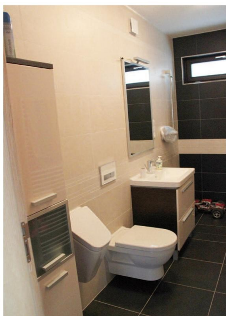
Koupelna s WC, pisoárem, umyvadlem a sprchou

Nabídka materiálů užívaných v sanitární technice je velmi pestrá. Na prvním místě je to zdravotnická keramika, která patří k nejstarším materiálům používaným pro koupelňové předměty – umyvadla, klozety, bidety apod. Tento keramický materiál je vysoce kvalitní a má výborné vlastnosti. Podle nových trendů se sanitární keramika rozděluje do několika kategorií od základní, přes střední, až po designové