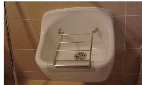
Výlevka v místnosti pro domácí práce

Výrazný rozvoj nastal u plánování sprchového koutu, kdy je třeba vycházet především z požadované funkčnosti, praktičnosti, se vzájemným sladěním s ostatním zařízením koupelny spolu s možností jeho umístění, velikostí sprchovacího prostoru, otvíráním sprchových dveří atd. Volba typu je individuální a měla by vycházet z potřeb budoucího uživatele a daného prostoru, který je k dispozici. Dnes existují na trhu stovky variant sprchových koutů s nejrůznějším vybavením, ať již materiálovým nebo tvarovým. Pro koupelny finančně náročnější nebo pro handicapované uživatele lze použít