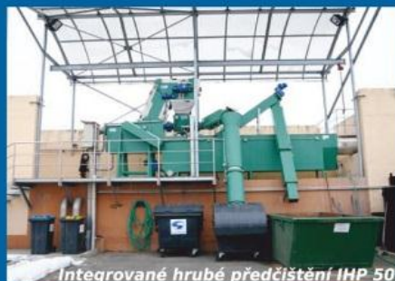
Integrované hrubé předčištění IHP 50

Naše výrobky jsou v kontaktu s odpadní vodou 24 hodin denně 365 dní v roce. Proto klademe důraz na kvalitu a spolehlivost výrobků a také pohotový servis.