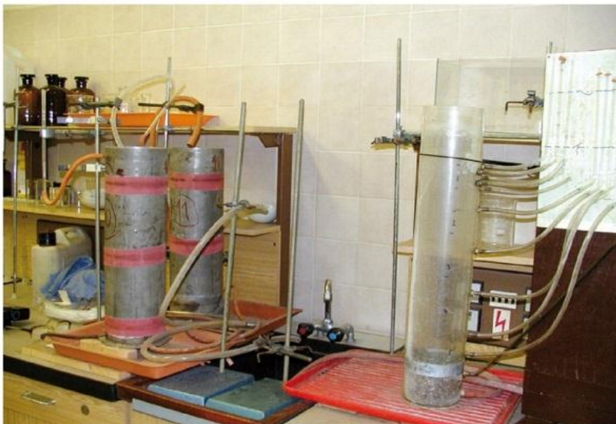
Obr. 1 – Laboratorní zkušební kolony určené ke stanovení hydraulické vodivosti nenarušených a narušených vzorků půdy

Při povolování vypouštění čištěných odpadních vod do půdy a podzemních vod