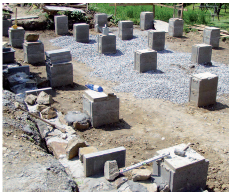
Základové patky jsou úspornější variantou pasových základů a betonové desky. Na nich stojí roznášecí modřínový práh a dřevěné I nosníky zavěšené proti klopení, které tvoří rošt pro izolaci.