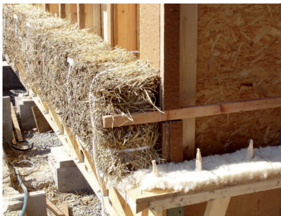
Slaměné balíky jsou přivazovány k dřevěné konstrukci, prostor za nimi je vyfoukán celulózou.

■ Konstrukci střechy tvoří 50 cm vysoké skříňové dřevěné vazníky, vyráběné místním stolem. Prostor mezi vazníky byl vyfoukán