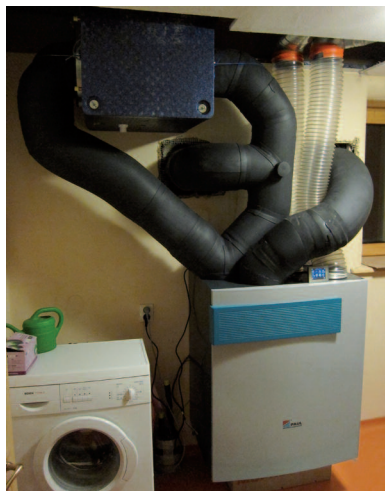
Větrací jednotka s rekuperací tepla včetně zemního výměníku. Alternativy ke kovovým rozvodům mohou být textilní nebo dřevěné rozvody.