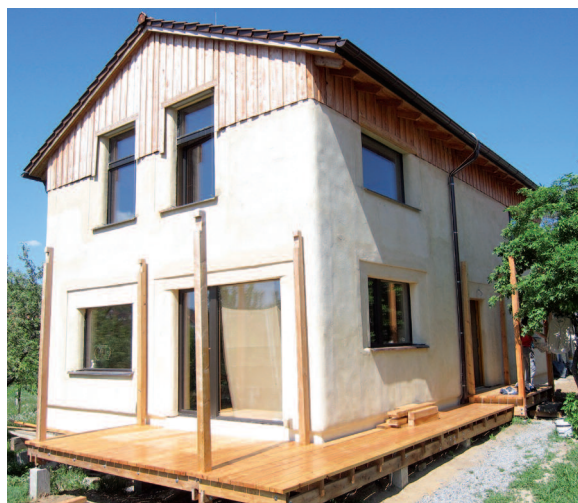
Pasivní dům v Habrovanech JZ štitová stěna a JV fasáda.

Pozemek je umístěn v polořadové zástavbě s výrazným stíněním sousedním domem z jihovýchodní strany ve vzdálenosti pouze 5,5 m. Díky orientaci pozemku 45° od jihu bylo využití solárních zisků ještě ztíženo a dosažení pasivního standardu vyžadovalo precizní optimalizaci oken a jednotlivých konstrukcí a jejich napojení. Je však vidět, že i v takhle komplikovaných podmínkách není